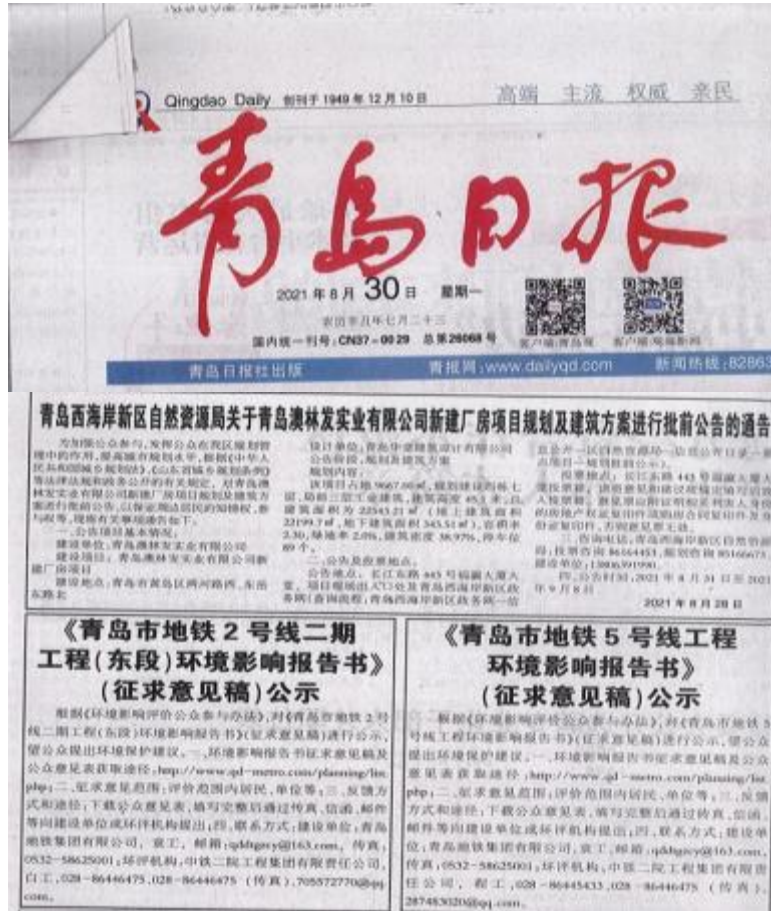
图3 征求意见稿第一次报纸公示截图