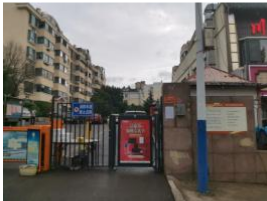
金秋小区西区、晟业小区