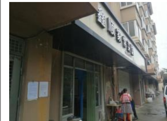
青岛鲁强集团宿舍