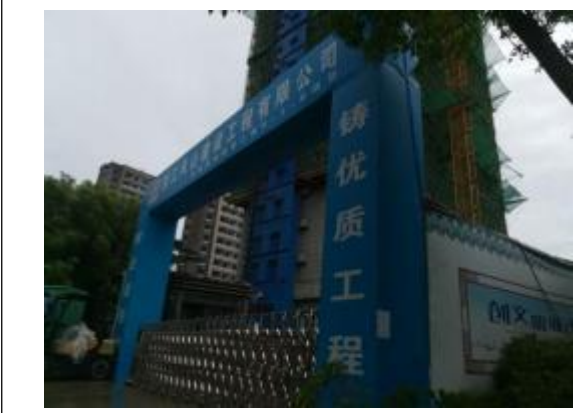
绿城理想之城 B-3-8 地块（在建）