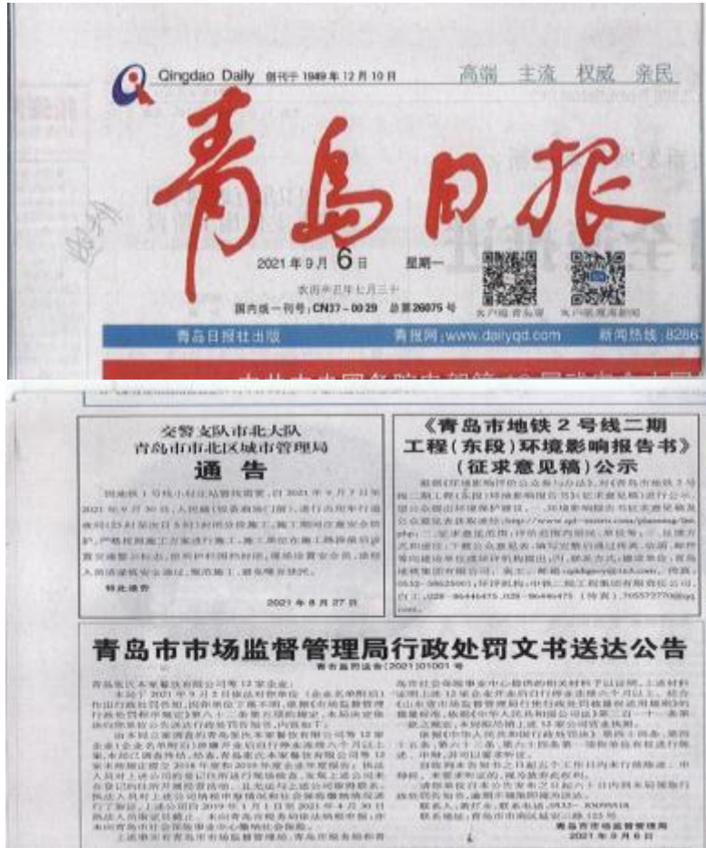
图 4 征求意见稿第二次报纸公示截图