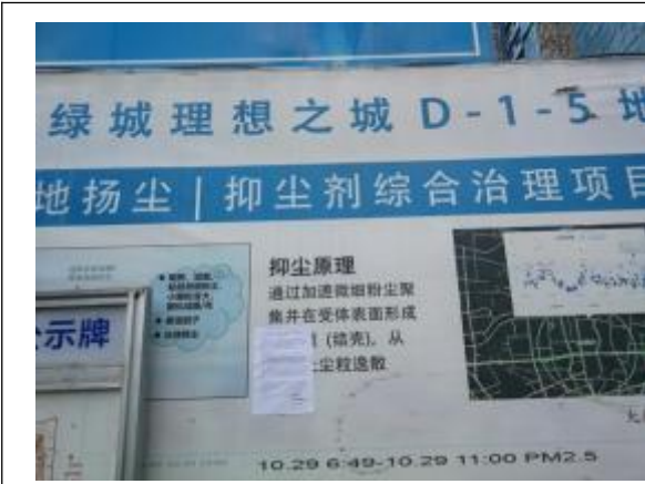
绿城理想之城 D-1-5 地块（在建）