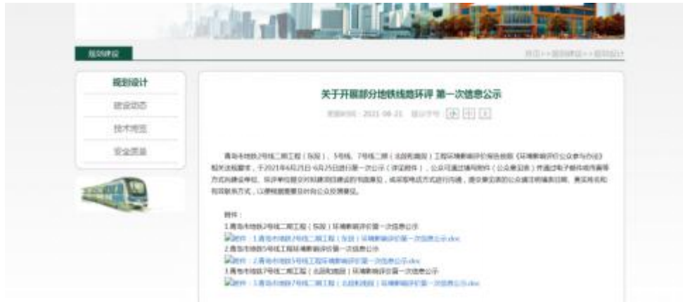
图 1 第一次信息网络公示截图