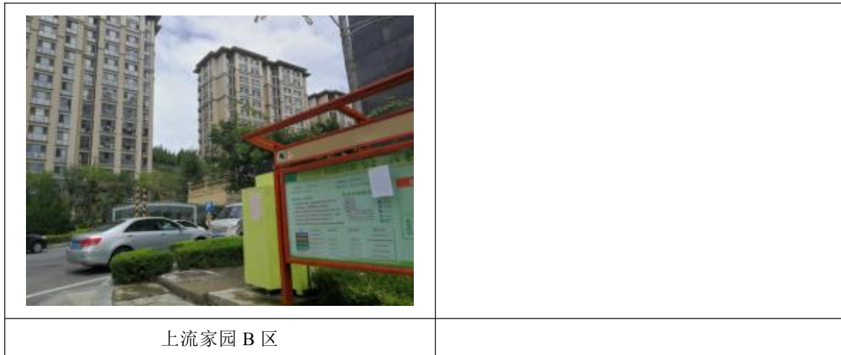
图 6 沿线张贴公告照片