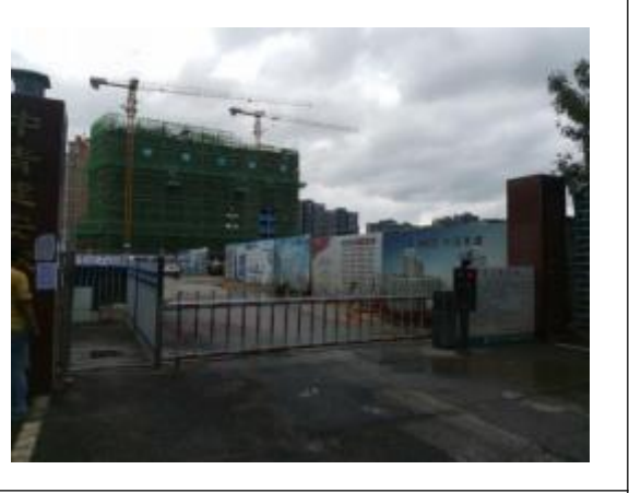
青岛市第八人民医院东区（在建）