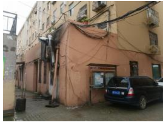
金水路 583、585、587 号