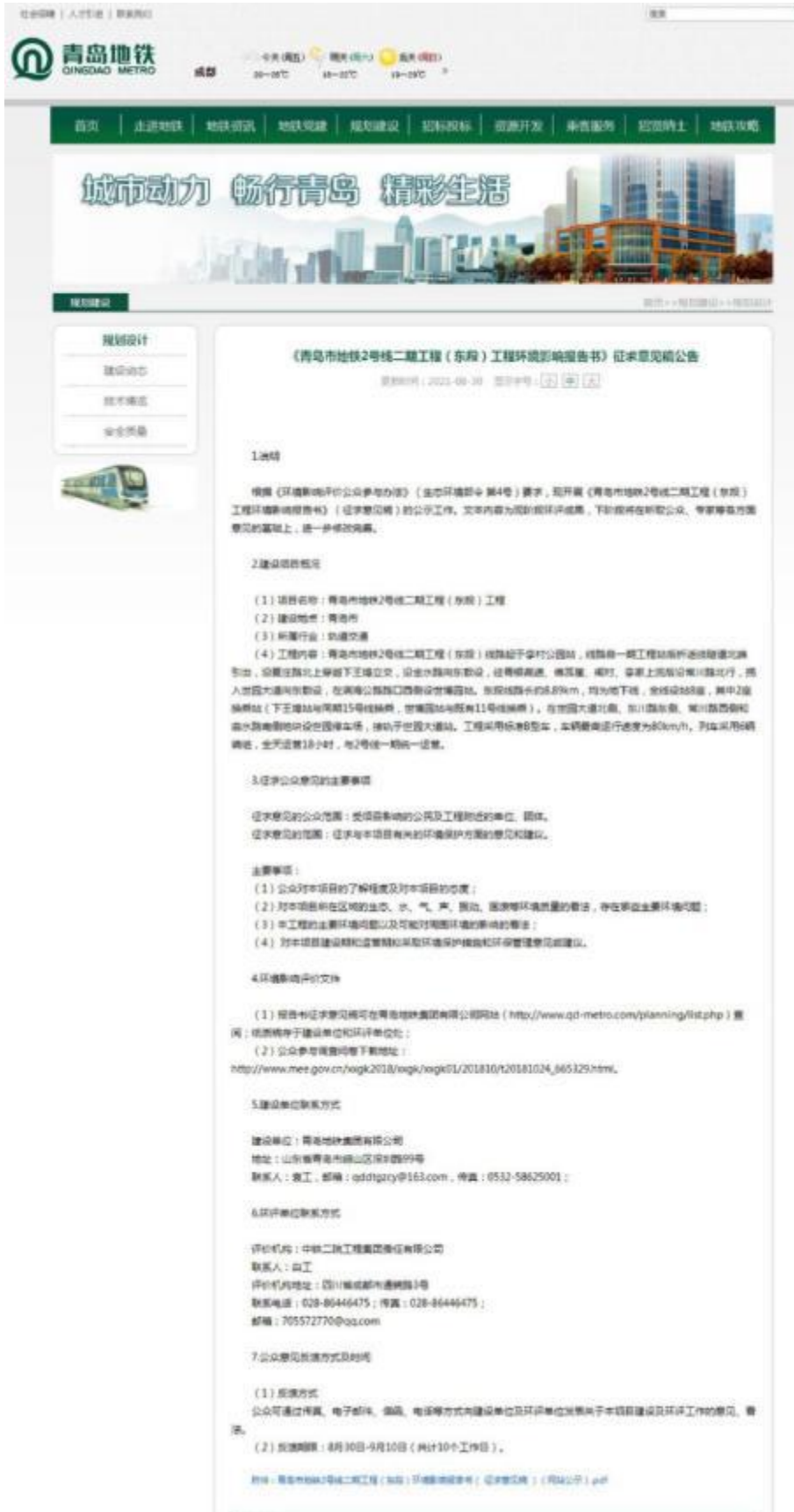
图2 征求意见稿网络公示截图